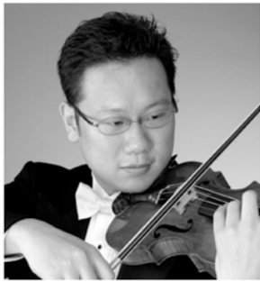
特別ゲスト / 田野倉雅秋 (ヴァイオリン) Masaaki Tanokura, Violin

コンサートマスター就任前から何度もPACと共演してきた田野倉と弦楽セクションが贈る珠玉の演奏に、どうぞご期待ください!