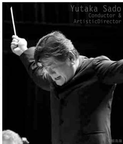
Yutaka Sado Conductor & Artistic Director

フィナーレを飾るのは、大序曲「1812年」。華やかなブラス、豊かな歌心とともに鳴らす弦楽器、鳴り響く大砲や教会の鐘の音。これぞ大編成オーケストラの醍醐味という、迫力満点の音楽にご期待ください。