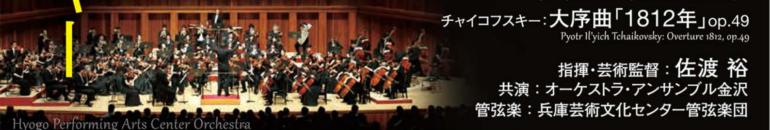
Hyogo Performing Arts Center Orchestra