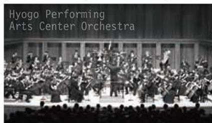
Hyogo Performing Arts Center Orchestra

1988年、岩城宏之が創設音楽監督を務め、多くの外国人を含む40名からなる日本最初のプロの室内オーケストラとして石川県と金沢市が設立。金沢駅に隣接する石川県立音楽堂を本拠地とし、定期公演、海外公演など年間約100公演を行う。設立時よりコンポーザー・イン・レジデンス(現コンポーザー・オブ・ザ・イヤー)制を実施。ジュニアの指導、邦楽との共同制作など育成・普及活動にも積極的に取り組む。メジャーレーベルより90枚を超えるCDを発売。2007年より、井上道義が音楽監督を務める。 http://oek.jp/