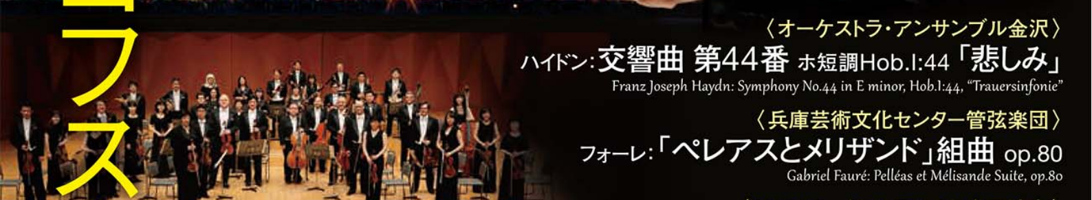
Orchestra Ensemble Kanazawa