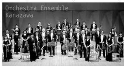
Orchestra Ensemble Kanazawa

国内では兵庫県立芸術文化センター芸術監督、シエナ・ウインド・オーケストラの首席指揮者を務める。CDは「ベートーヴェン(運命)/シューベルト(未完成)(ベルリン・ドイツ交響楽団)」など多数リリース。最新盤としてトーンキュンストラ管弦楽団との4枚目のCD「シベリウス: 交響曲第2番/フィンランディア」を2017年4月にリリース。著書に「僕はいかにして指揮者になったのか」(新潮文庫)、「棒を振る人生〜指揮者は時間を彫刻する〜」(PHP新書/PHP文庫)などがある。オフィシャルファンサイト: http://yutaka-sado.meetsfan.jp