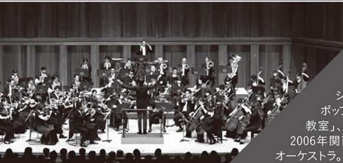
Hyogo Performing Arts Center Orchestra

近年はケルン・ギュルツェニヒ管弦楽団と数多くの録音を行っており、2005年のショスタコーヴィチの交響曲全集はエコー・クラシック賞を受賞。プロコフィエフ交響曲全集、チャイコフスキー交響曲全集も絶賛されている。現在はラフマニノフ・ツィクルスが進行中。ニコライ・マルコ国際青年指揮者コンクールの審査員を務めており、後進の育成にも当たっている。